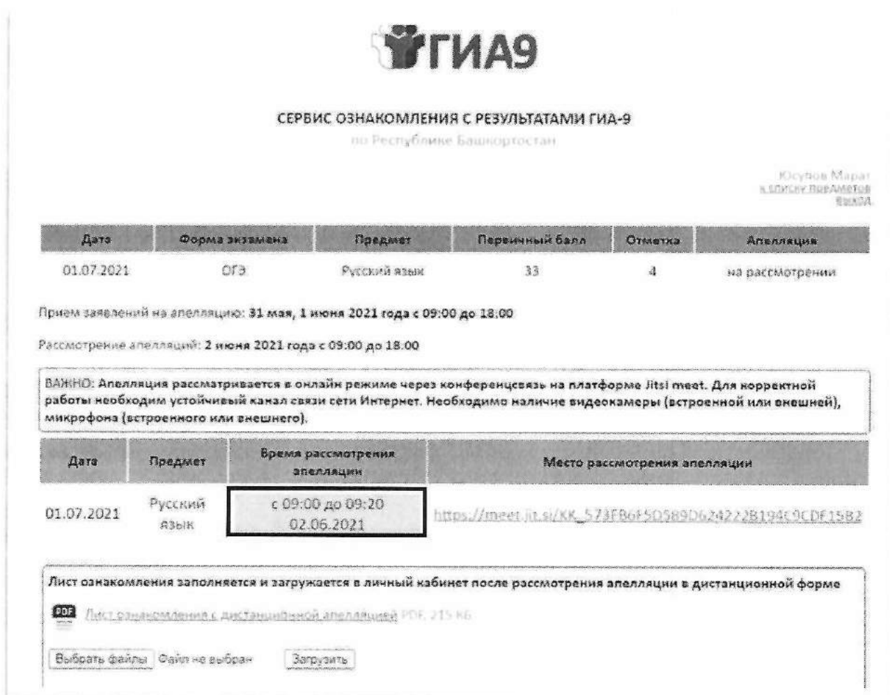
Рисунок 6. Страница с результатами по экзамену с информацией о времени рассмотрения апелляции, со ссылкой на комнату видеоконференции

Подача и рассмотрение апелляции о несогласии с выставленными баллами проводятся в онлайн режиме.